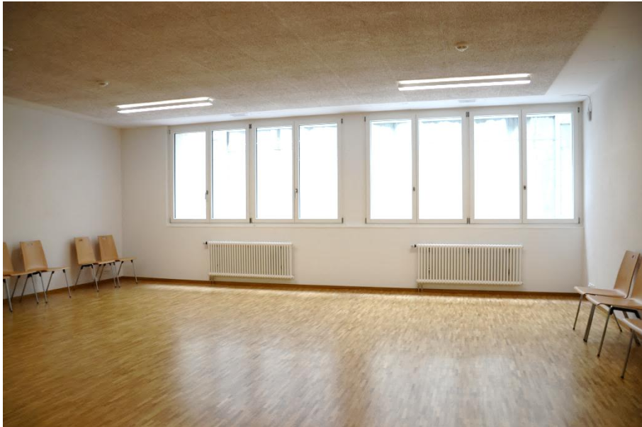
Oscar Romero Bewegungsraum

Der Spiel- und Bewegungsraum im 1. UG ist bewusst spärlich möbliert, so kann er für kleinere Gruppen für Yoga oder Pilates genutzt werden, oder als Spielzimmer für Eltern-Kind-Gruppen.