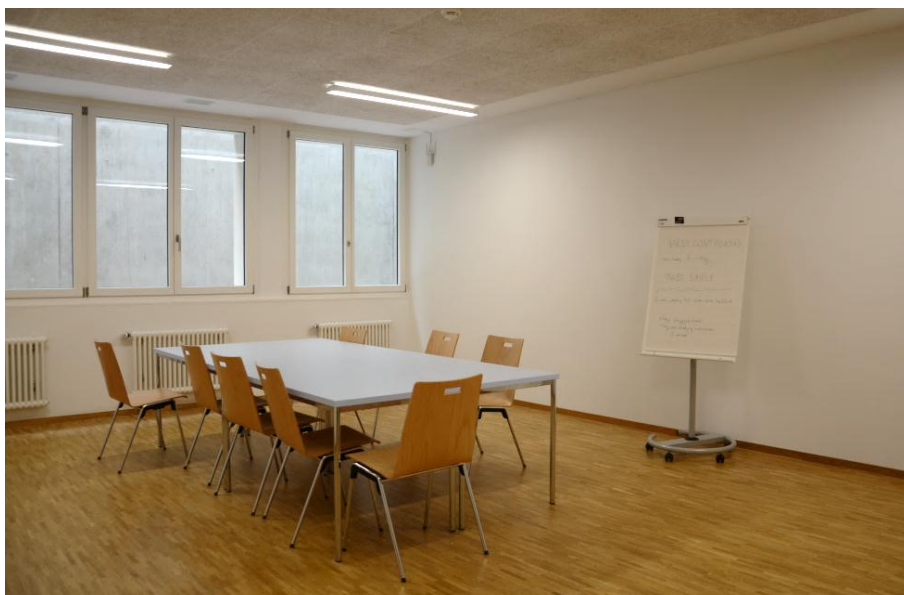
Martin Luther King Jugendraum

Der Raum Mahatma Gandhi ist mit normalen Tischen und Stühlen ausgestattet und wird gerne für Nachhilfeunterricht genutzt.